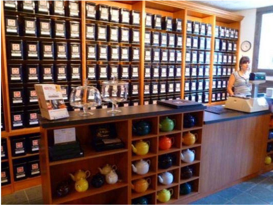
Il y a plus de 250 variétés de thés