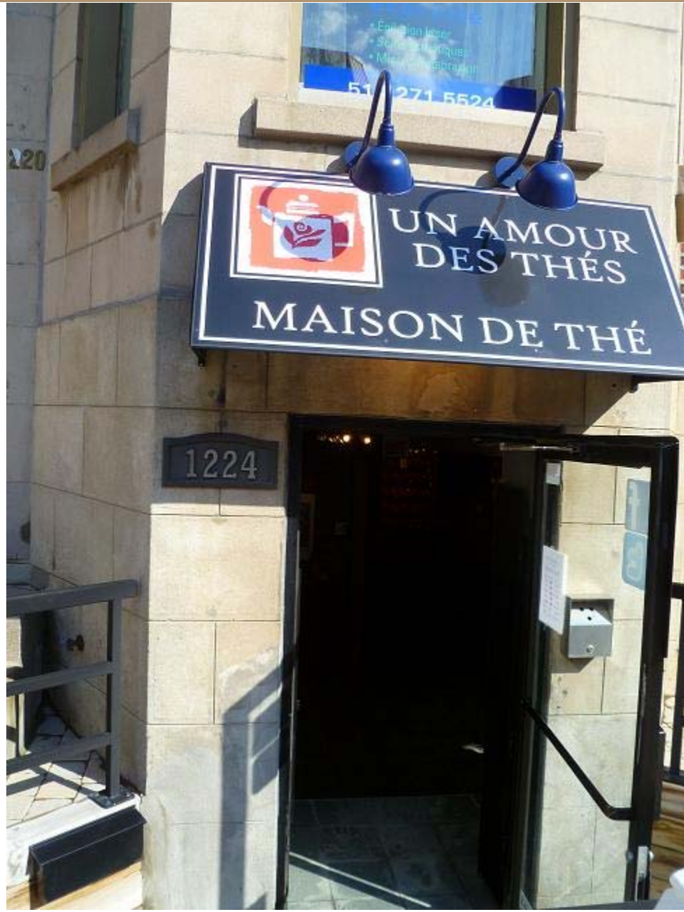
Vue de la rue Bernard