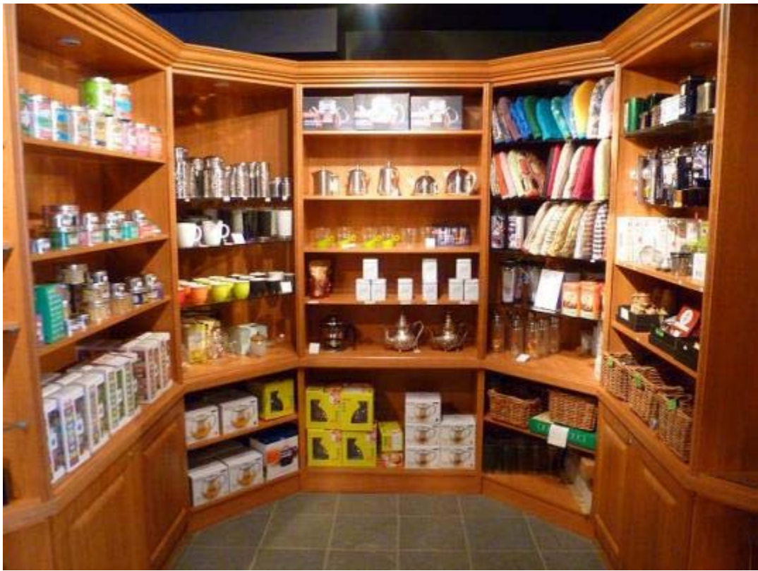
Beaucoup de produits reliés au thé