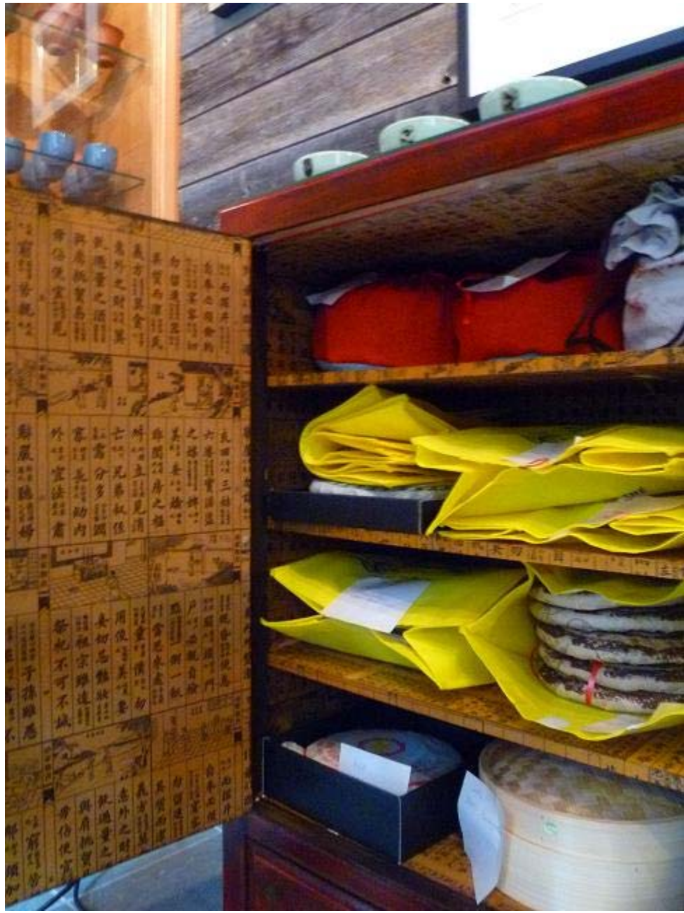
Armoire à Pu-Erh.