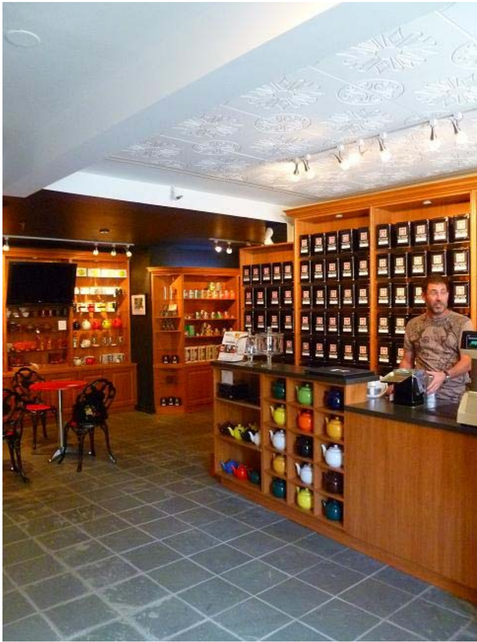
La boutique est spacieuse.