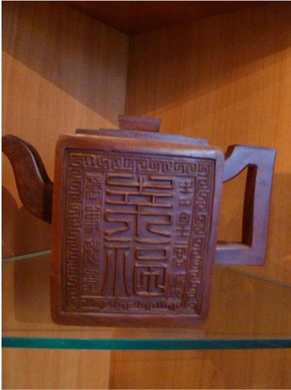
Cette théière Xi Ying a inspiré le changement vers un nouveau logo.