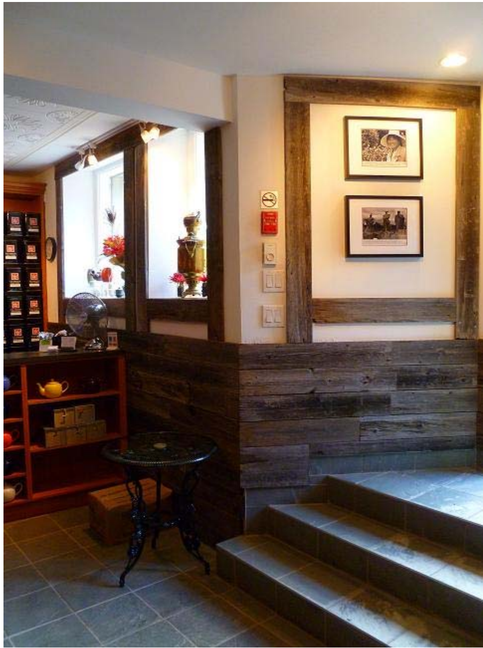
Le décor est accueillant. Des photos du récent voyage du propriétaire en Chine sont affichées dans la boutique.